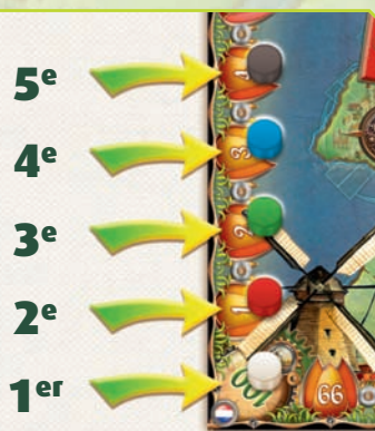
Position de départ des joueurs

Chaque joueur après le premier commence la partie un cran plus loin que le joueur précédent sur la piste des scores. Ceci compense le léger avantage des premiers joueurs.